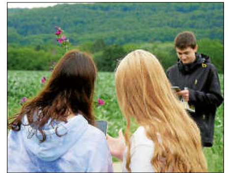
Die 9e beim Bestimmen von Pflanzen

Baumes hingen, durch die Last der Früchte nach unten gezogen, in Kopfhöhe, sodass man noch nicht einmal eine Leiter brauchte, um sie zu pflücken. Leider schmeckten die Sauerkirschen nicht allen. Aber die Süßkirschen sind auch bald reif.