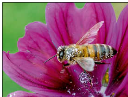
Eine Biene auf der Streuobstwiese

Auf der Streuobstwiese des Ettlinger Heisenberg-Gymnasiums stehen nicht nur Zwetschgen-, Apfel- und Kirschbäume. Schon von weitem erkennt man die Vielfalt der Gräser und Blumen auf dem Grundstück. Wer sich der Wiese von Ettlingen kommend nähert, sieht gleich am Eingang ein Insektenhotel, das während der letzten Projektstage gebaut wurde. So erstaunt es nicht, dass tagsüber ein wildes Gewimmel an Bienen, Hummeln und anderen Insekten zu beobachten ist.