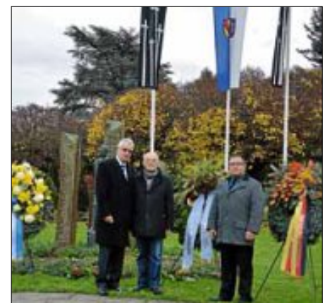
Beim Volkstrauertag auf dem Ehrenhain des Ettlinger Friedhofs der Vorstand des VdK nach der Kranzniederlegung.