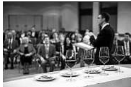
Brot und Wein sind jeher die typischen Symbole des Abendmahles

Mehr Informationen kann man im Video „In Erinnerung an Jesu Tod“ auf der Webseite www.jw.org erhalten.