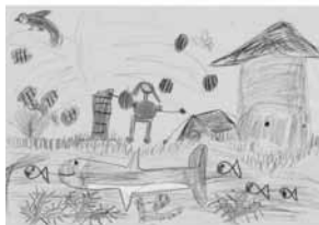
Plakat: Städtischer Kindergarten