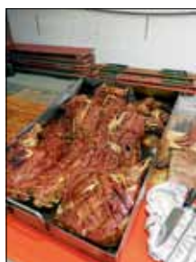
Spanferkel 2018

Genießen Sie bestes Spanferkel frisch aus dem Ofen mit leckerem Sauerkraut und knusprigem Bauernbrot.