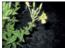
Nachtkerze im Garten

Ein optimal funktionierender Stoffwechsel verhilft uns zu guter Gesundheit, Leistungsfähigkeit , einer guten Figur und einem erholsamen Schlaf .