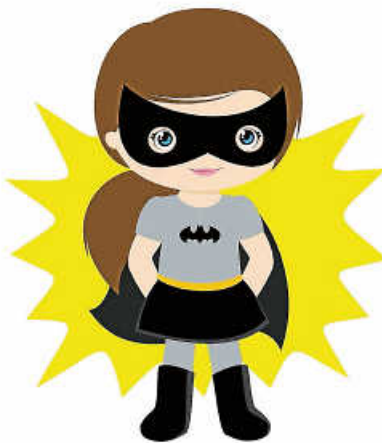
Grafiken: Klünder