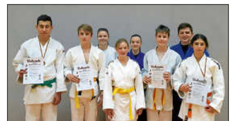
Erfolgreiche Judoka mit den Trainern