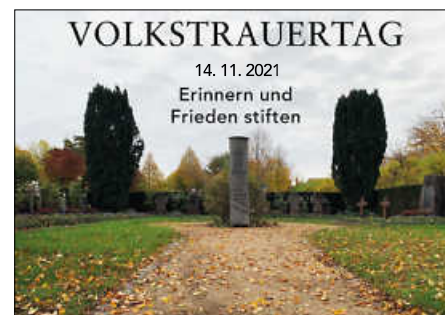
14.11.2021 12 Uhr