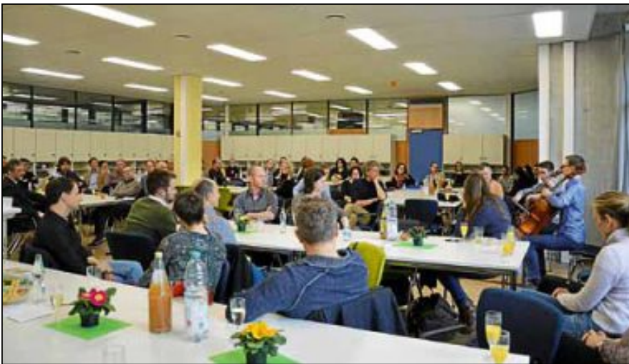
Ein lichter Raum ist das neue Lehrerzimmer im Albertus-Magnus-Gymnasium geworden.

Gut Ding braucht Weile oder was lange währt, wird endlich gut. Man könnte die Reihe an Sprichwörtern fortsetzen und sie würden alle treffgenau beschreiben, was auf das neue Lehrerzimmer am Albertus-Magnus-Gymnasium zutrifft. Am vergangenen Freitag konnte dieser neue, nun lichte und großzügige Raum endlich übergeben werden. Notwendig wurde das neue Lehrerzimmer, da aus dem einst dreizügigen AMG eine vierzügige Einrichtung wurde, sprich pro Klassenstufe gibt es vier Klassen, was bedeutet, es gibt auch mehr Lehrkräfte. Bis dato bot das Lehrerzimmer nur Platz für rund 50 Personen, aber es waren 75