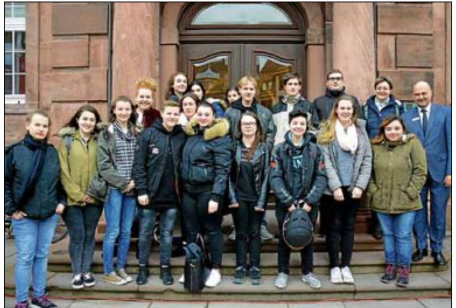
Eine Woche lang stand für die 17 Schüler der Berufsfachschule Bertha-von-Suttner-Schule die sozialen Facetten Ettlingens im Mittelpunkt.