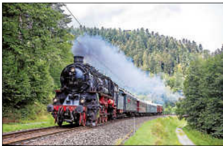
Die über hundertjährige badische G12 und ihre Wagen, die auch schon Ü80 sind

Jetzt am Sonntag fährt wieder der Zug der Dampfostalgie Karlsruhe mit der Dampflok 58 311 entlang der Alb, wo sonst nur moderne Straßenbahn-Wagen fahren, nach Bad Herrenalb. Der Zug besteht aus Eilzugwagen aus den 30er-Jahren, einem passenden Speisewagen, wo Sie sich stärken können, und einem Gepäckwagen, der Fahrräder gerne kostenlos befördert.