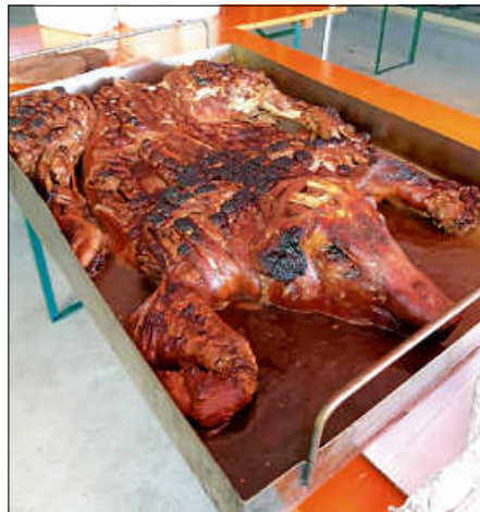
Unser leckeres Spanferkel