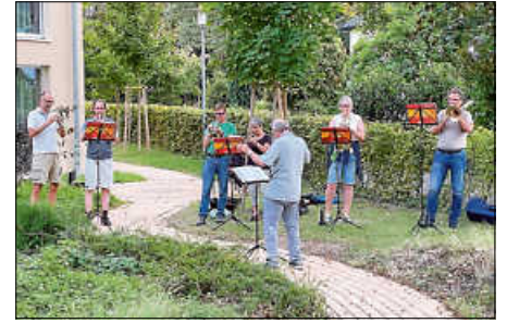
Der Posaunenchor spielt im Garten des Seniorenhaus Bruchhausen

Einen herzlichen Dank an alle Musiker für den schönen Abend.