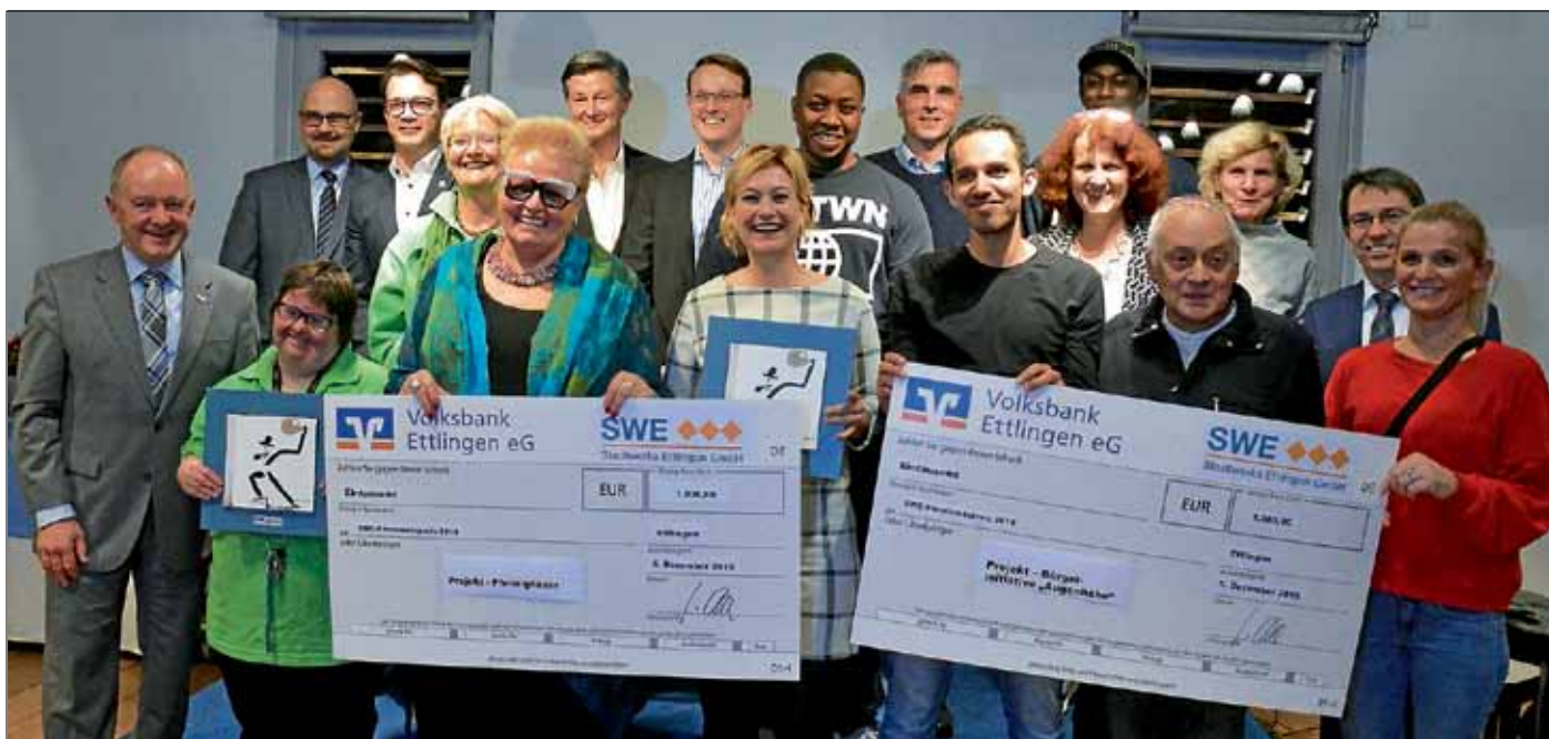
Die Preisträger des 5. SWE-Ehrenamtspreises mit Stadtwerkechef Oehler und OB Arnold.