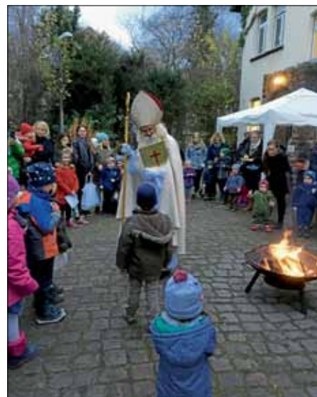
Der Nikolaus beschenkt die Kinder im effeff

Vielen Dank, lieber Nikolaus und allen effeff-Helfern!