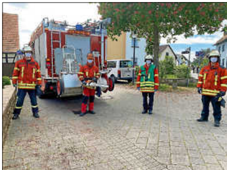
Einsatz vom 03.05.2020

Bitte nicht erschrecken, das ist keine Szene aus einem Horrorfilm, sondern ein realer Einsatz: