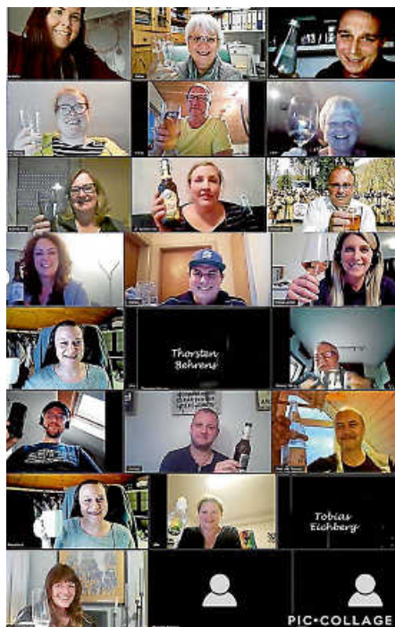
Prost auf's Jubiläum

#33+1 #jubifiEBERverlängerung #wirhaltenZusammen #tanzindenmai #NieOhnemeinEber