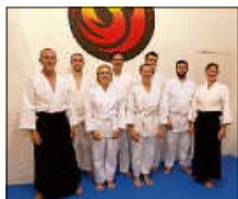
Aikidoka nach bestandener Prüfung

www.phoenix-albtal.de oder rudi.maier@phoenix-albtal.de Tel.: 015773993096