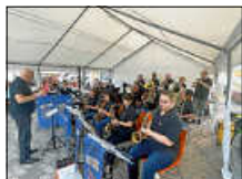
Auftritt Straßenfest Lingenfeld

Endlich, nach zwei Jahren Pause, fand unser schon traditioneller Auftritt am Straßenfest Lingenfeld, am Stand unseres befreundeten Musikvereins, den Lingenfelder Dorfmusikanten, am vergangenen Samstagabend statt. Bei sommerlichen Temperaturen können wir auf einen gelungenen Auftritt zurückblicken.