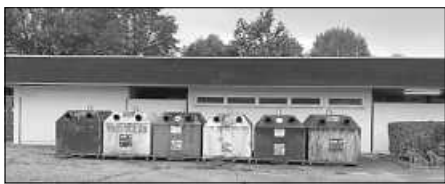
Altglascontainer Buchzig

In Ettlingenweier gibt es vier Standorte zum Sammeln von Altglas. Die Container befinden sich auf dem Parkplatz der Bürgerhalle, bei den Parkplätzen an der Dorfwiesenstraße und bei den Parkplätzen vorm Friedhof in der Groß-Ott-Str.