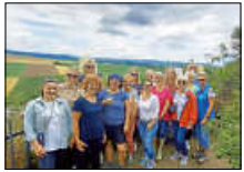
Bohneringel Ausflug

Am 30.07.2023 fand der Ausflug der Bohneringel statt. Am frühen Morgen starteten die Frauen bei dunklen Wolken und Regen in Richtung Lauffen am Neckar.