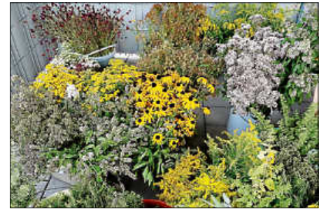
Kräuter im Kräuterbüschel