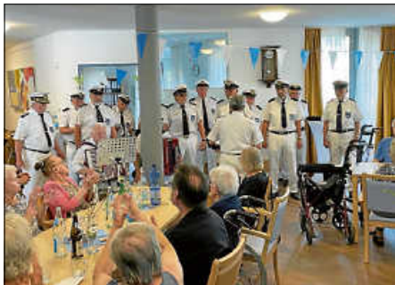
Der Shanty-Chor der Marinekameradschaft Ettlingen Albtal e. V.

Das kulinarische Angebot rundete alles ab. Die Hauswirtschaft servierte hausgemachten Kartoffelsalat mit Backfisch, dazu selbstgemachte Remoulade; als Nachtisch ein norddeutscher Klassiker: Rote Grütze mit Vanillesauce. Bei allen Mitarbeitern, dem Shantychor, den Helfern aus dem Betreuten Wohnen möchte ich mich als Heimleiter für das Gelingen danken.