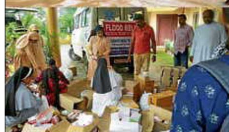
Flutopfer auf der Flucht erhalten medizinische Hilfe.

So konnte der wieder einmal große Ertrag des Bäckerei-Frühschoppens, der wie seit vielen Jahren auf dem Gelände der Bäckerei Nußbaumer im April 2019 stattfand, sinnvoll eingesetzt werden. Fleißige „Helferlein“ von ortsansässigen Vereinen und Angestellte der Nußbaumerschen Bäckerei machten diesen Erfolg möglich.