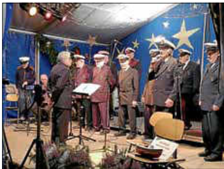
Der Shantychor wünscht frohe Weihnachten

Der Shantychor benötigt dringend Verstärkung. Deshalb würde er sich sehr freuen, zur ersten Chorprobe im neuen Jahr, am 9. Januar 2020, den einen oder anderen neuen interessierten Sänger begrüßen zu dürfen. Wer sich über den Verein und den Chor informieren möchte, unter www.mk-ettlingen-albtal.de ist das möglich.