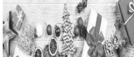
Udo Schmitz Plakat: Rheuma-Liga BW e.V.

Unsere Beratungshotline ist wieder ab dem 07. Januar 2020 erreichbar.