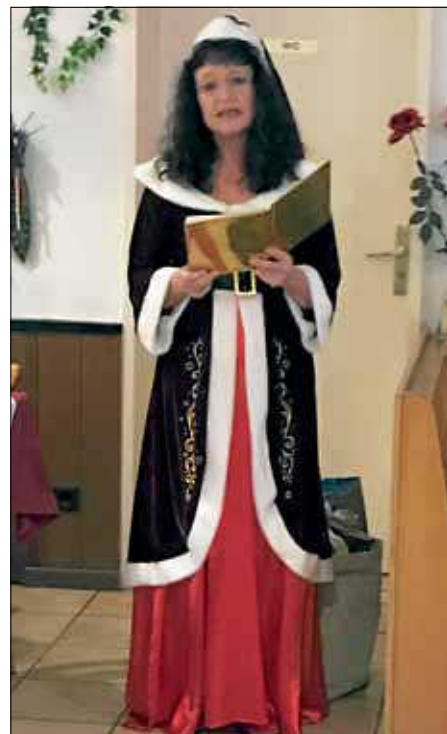
Frau Santa Klaus