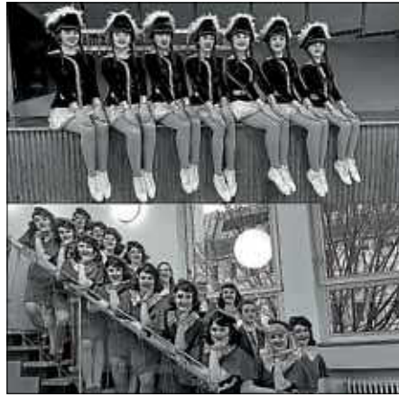
Smaragd- und Saphirgarde beim Turnier in Pforzheim

Wir wünschen euch allen eine schöne Weihnachtszeit und einen guten Start in 2020. Im neuen Jahr werdet ihr bestimmt wieder von uns hören, also seid gespannt.