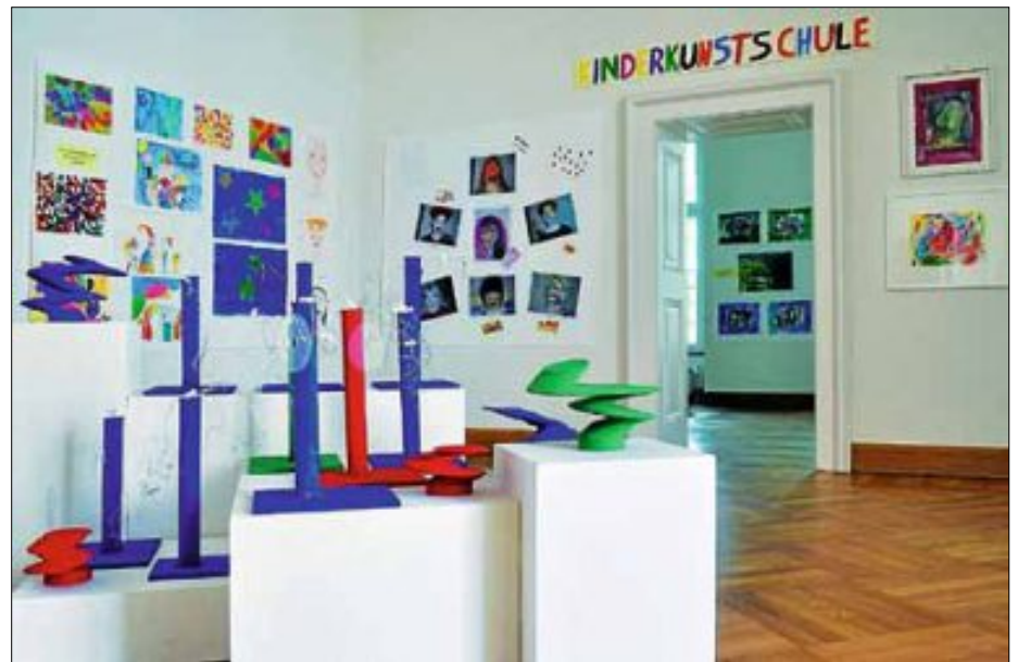
Eine Studioausstellung mit Bildern und Objekten aus den Jahreskursen der Kinderkunstschule ist im Schloss zu sehen.

Bis zum 30. April stellen die Kinder der sechs Kinderkunstschulkurse aus drei verschiedenen Altersgruppen zwischen 5 und 12 Jahren ihre Lieblingsbilder und -objekte aus früheren und auch aus den aktuell laufenden Kursen aus. Da vor der kreativen Arbeit in der Werkstatt häufig eine Entdeckungstour durch die Städtische Galerie oder die Sonderausstellungen unternommen wird, wundert es nicht, dass immer wieder der Wunsch nach einer eigenen Ausstellung geäußert wurde. Endlich konnte sie verwirklicht werden, und die Betrachter werden staunen. Denn die Bandbreite der gezeigten Arbeiten ist sehr groß.