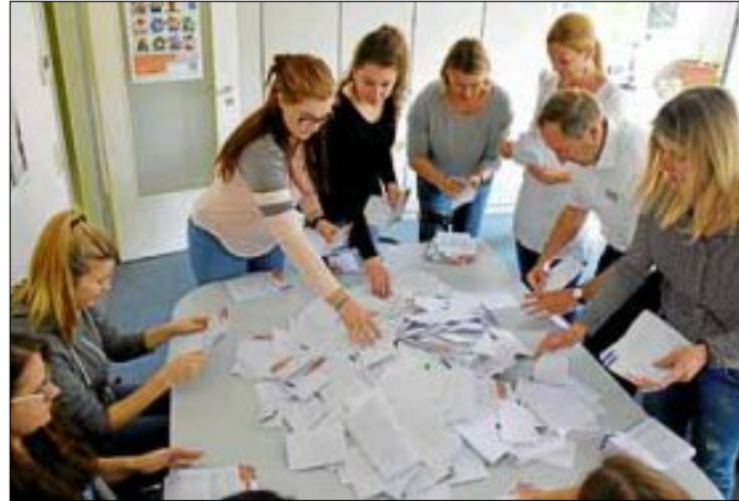
Die Mitarbeiter des Bildungsamtes zählen die Stimmen zur Jugendgemeinderatswahl aus.