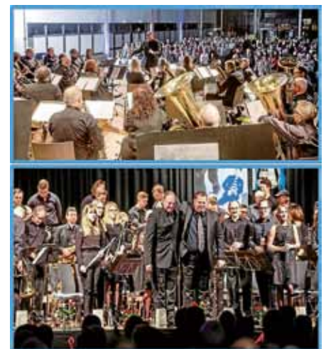
Konzertimpressionen