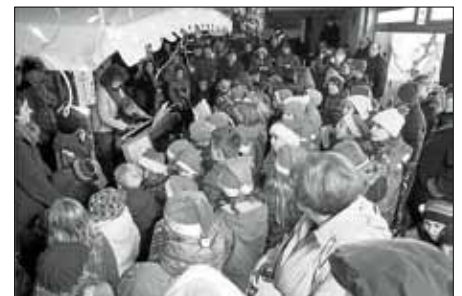
Der Schulchor singt Adventslieder

Endlich ist es wieder so weit - der Gewerbeverein Bruchhausen richtet seinen alljährlichen Adventszauber vor dem Cap-Markt Bruchhausen aus. Am 8.12. von 17 bis 20 Uhr werden wir alle vom Schulchor und vom Musikverein auf Weihnachten eingestimmt. Bei Glühwein, Kinderpunsch, Bratwurst, Pommes und Waffeln genießen wir die Adventszeit. Wir alle freuen uns auf ein paar schöne Stunden mit Ihnen bei Musik, guten Gesprächen und einem Becher Glühwein.