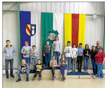
Unsere Pokalgewinner

Wann machen wir denn wieder ein Pokalschießen? (Antwort: vermutlich zum Nikolaus)