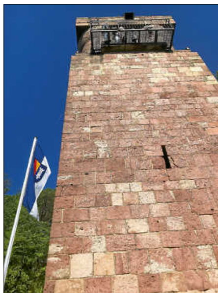
Kaiservetter beim Weitblick vom Bismarckturm

Auftakt dieser Saison bildete der Ostersonntag. Strahlend blauer Himmel und Sonne satt bei angenehmen Temperaturen zogen Wanderer und Spaziergänger hoch auf den Berg, selbst Biker und Reiter machten Station am Turm. Insgesamt 130 Besucher nutzten den Aufstieg zur Plattform, um den Blick weit über die Rheinebene, den Pfälzer Wald, die Vogesen und die Vorbergzone des Nord-Schwarzwaldes streifen zu lassen. Die Begeisterung stand vielen Besuchern geradezu ins Gesicht geschrieben. Aufgrund der Enge und des möglichen Begegnungsverkehrs auf der Treppe bestand eine Maskenpflicht innerhalb des Turmes. Sehr zu unserer Freude wurde diese Vorgabe weitestgehend akzeptiert und teilweise sogar begrüßt. Somit wurde die erste Turmöffnung des Jahres ein voller Erfolg.