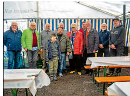
„Unterstützer“ und Helfer beim Helferfest