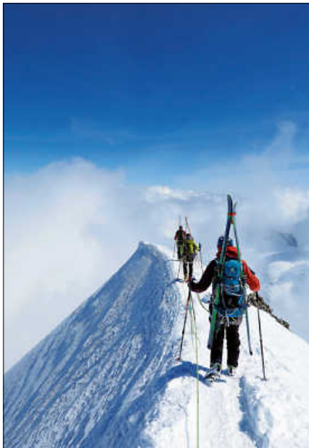
Auf dem Grat des Piz Palü

Auch der zweite Teil der Tour, die Überschreitung des Piz Palü (3899m) mit seinen zahlreichen Gipfeln und dem sehr schmalen 2km langen Firngrat, war ein Highlight. Und die Abfahrt setzte nochmal einen obendrauf: Die Wegführung durch den eh schon zerklüfteten Gletscherbruch war dieses Jahr mit dem wenigen Schnee unglaublich: Bergführer haben Absätze in die Spaltenränder geschlagen, um den Weg überhaupt möglich zu machen. Einmal mussten wir gar auf den Boden einer breiten Gletscherspalte fahren, um an deren Ende wieder „ausgespuckt“ zu werden. Die Abfahrt zum letzten Aufstieg unserer Tour war ebenfalls einfach paradiesisch. Sonne, warm, weicher Schnee, beeindruckender Ausblick – was will man mehr.