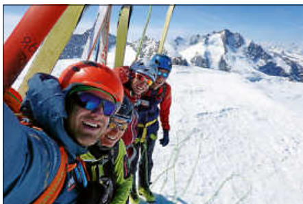
Auf dem Gipfel des Piz Palü mit Blick auf Piz Bernina und Piz Zupo

Auf den 1000 Höhenmetern über die Piste zum Auto hatten wir zwar teils Nebel – aber