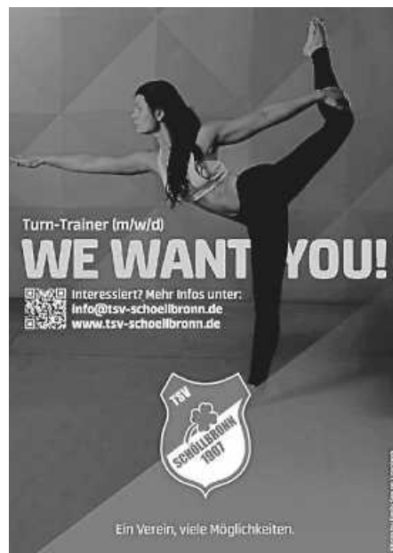
Plakat: TSV Schöllbronn

Wir suchen für unsere ehrgeizige und durchmischte Geräteturngruppe einen motivierten Trainer eine motivierte Trainerin zum nächstmöglichen Zeitpunkt.