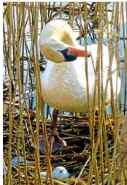
Ganter 'Fritz' beäugt begeistert das Ostern-Überraschungs-Pracht-Ei seiner 'Frieda'...