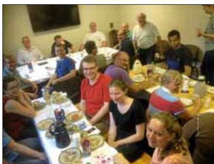
Ein Teil der Helfer bei einer wohlverdienten Pause.

Es gäbe noch viel zu erzählen – angefangen von der Küchenmannschaft, den herrlichen Kuchen und liebevoll hergerichteten Mahlzeiten bis..... Aber dafür reicht der Platz wahrscheinlich nicht. Wir freuen uns alle, ab Mittwoch den renovierten Königreichssaal für eine würdige Anbetung wieder benutzen zu können und danken unserem Gott Jehova dafür. Unser Königreichssaal kann zu den Versammlungszeiten von jedem besucht werden. Also ist jeder eingeladen, mal vorbeizukommen, und sich selbst ein Bild von unserem alten neuen Königreichssaal zu machen.