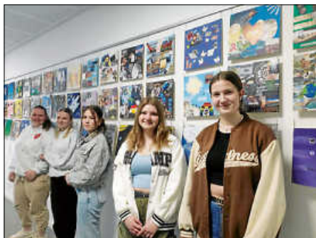
Schülerinnen der Klasse 1BKSP 1

Genauer können die Bilder auf unserer Homepage www.bvsse.de betrachtet werden.