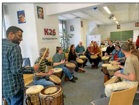
Rhythmisches Trommeln im K26

Das Café Vielfalt findet immer am 1. Dienstag des Monats (ausgenommen Ferien) jeweils von 16 – 18 Uhr im K26 Begegnungsladen statt. Der nächste Termin ist am 4. Juli. Kommen Sie doch auch einmal vorbei!