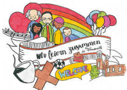
Grafik: Frederik Lowin

der Evang. Kirchengemeinde am Himmelfahrtstag 18. Mai in die Klosterruine nach Frauenalb