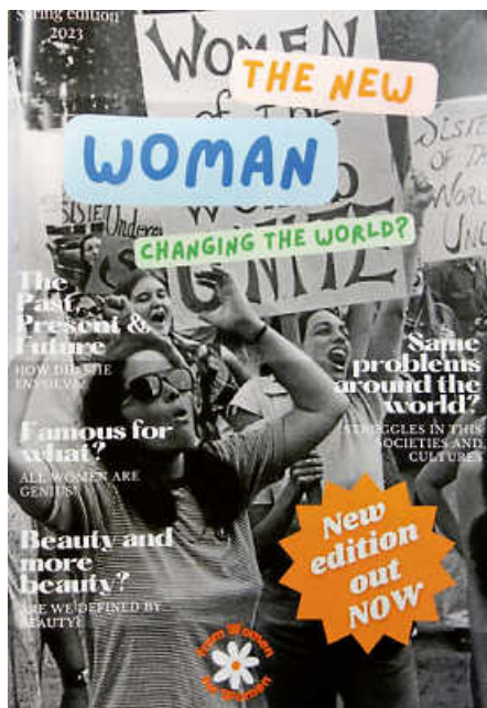
The New Woman: Eines der im Englischunterricht entstandenen Magazine

ren Schulhof ein von der SMV organisierter Flohmarkt statt, auf dem es sich gemütlich stöbern und shoppen lässt.