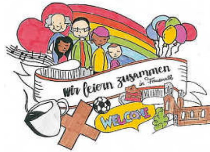
Grafik: Frederik Lowin

Wir freuen uns schon sehr auf unseren Gemeindeausflug am Himmelfahrtstag 26. Mai nach Frauenalb .