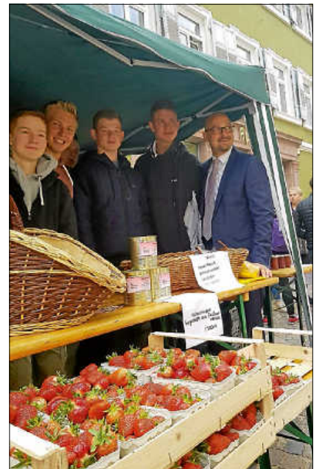
Bauernmarkt 2019

Vielen frische, saisonale Leckereien aus der Region bieten unsere Azubis am 1. Juni auf dem Ettlinger Wochenmarkt an. Ob Spargel, Erdbeeren, Kartoffeln, Brot oder Wurstwaren - sie werden an unserem Stand im Bereich des Schlossvorplatzes/Schlossapotheke zu finden sein. Kommen Sie vorbei, kaufen Sie regional und saisonal und das direkt von unseren engagierten Junglandwirten!