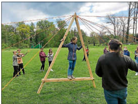
Spiel und Spaß bei der Klassenfahrt der 6c

Ein Bericht der Schülerinnen und Schüler der Klasse 6c