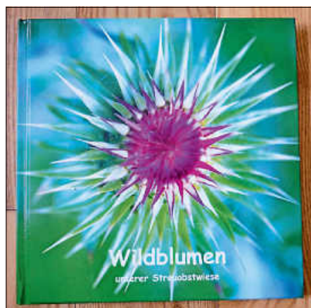
Erwartet Sie auf der Streuobstwiese: das neue Wildblumenbuch

Wir freuen uns über Ihren rücksichtsvollen Besuch und einen Eintrag in das Gästebuch, das Sie ebenfalls im Eimer finden.