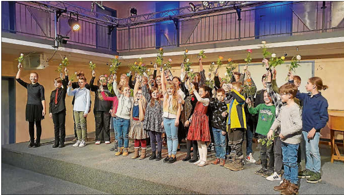
Preiswürdige Talente: alle Teilnehmerinnen und Teilnehmer der Ettliger Musikschule bei „Jugend musiziert“ wurden ausgezeichnet und präsentierten ihr Können beim Preisträgerkonzert.