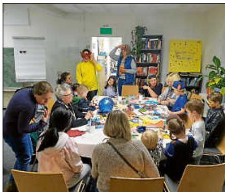
Ausgelassene Stimmung am Schmoziga Donnerstag mit Maskenbasteln und fetziger Musik