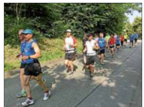
Am 13. Juli und 3. August sind die Vorbereitungsläufe für den 7. SWE Halbmarathon Ettlingen.

Wer sich für die große Schleife um Ettlingen anmelden möchte, geht einfach auf www.ssv-ettlingen.de . Die Startgebühr beträgt 15 Euro. Jeder Läufer/-in erhält eine Medaille und ein T-Shirt, das ihn an den 7. SWE-Halbmarathon erinnern wird; nicht zu vergessen die Jero-boam-Champagner-Flasche (3 Liter) aus Ettlingens französischer Partnerstadt Epernay für die finisherstärkste Gruppe.