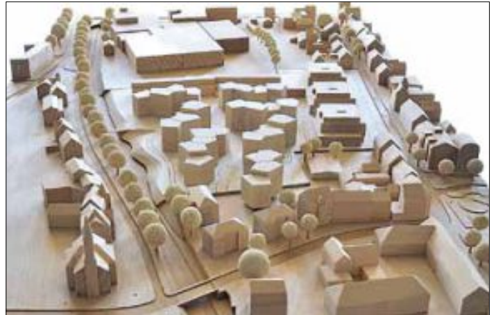
Das ehemalige Gelände von Koehler decor, rund drei Hektar groß (linkes Bild) und seine künftige Bebauung, im Hintergrund die Firma Bardusch und im Vordergrund links die Johanneskirche und die Alb.