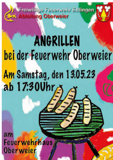
Plakat: C. Lang

Kommt am Samstag, 13. Mai, zum gemütlichen Angrillen am Feuerwehrhaus! Hier gibt's leckere Würstchen und kühle Getränke. Freut euch auf einen entspannten Abend mit Freunden und Nachbarn. Seid bei diesem neuen Ereignis der Freiwilligen Feuerwehr Oberweier dabei und lasst uns gemeinsam den Grill anfeuern!