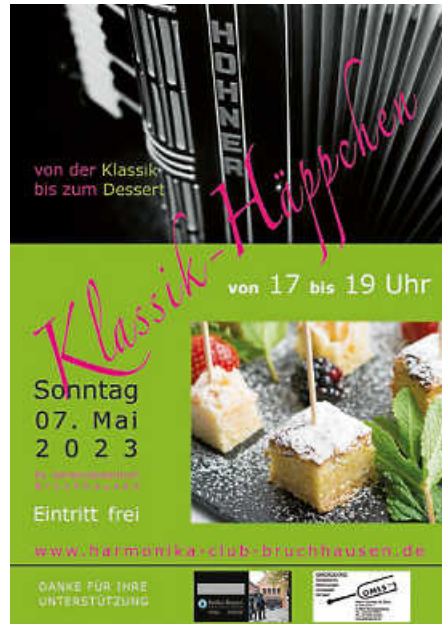
Plakat: Harmonika Club Bruchhausen e.V.

Bereits heute laden wir alle Freunde der Akkordeonmusik zu unseren KLASSIKHÄPPCHEN ein. Die Veranstaltung findet am Sonntag, 7. Mai, um 17 Uhr im Evangelischen Gemeindezentrum in Bruchhausen statt.