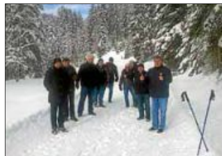
Wandern in idyllischer Winterlandschaft.