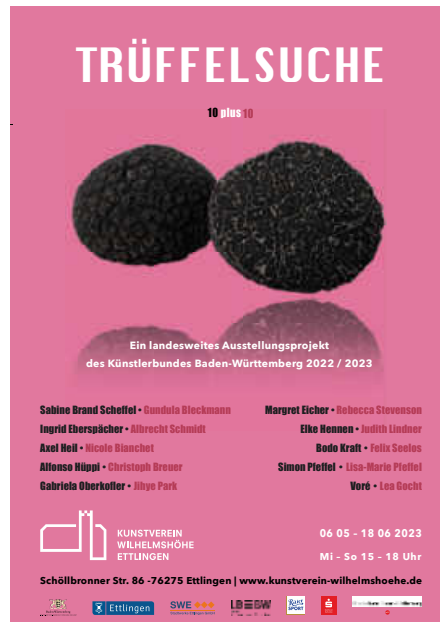
Plakat zu Ausstellung, Kunstverein Wilhelmshöhe, Ettlingen

anstelle seiner traditionellen Jahresausstellung seiner Mitglieder ein landesweites Ausstellungs-Projekt, das als Ausstellungsreihe satellitenartig über den Zeitraum von Mitte 2022 bis Mitte 2023 in über 70 kleineren ehrenamtlich geführten Kulturinstitutionen, Kunstvereinen und Projekträumen des Landes angelegt ist.