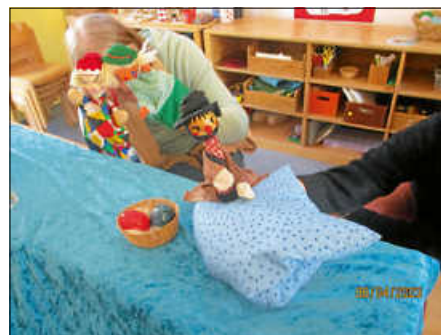
Kasperle und Seppel

Wir alle fühlen uns in unsere Kindheit zurückversetzt, wenn wir an Kasperltheater denken. Diese Faszination erleben wir als Erzieher*innen immer wieder, wenn wir dies den Kindern anbieten, meist als Highlight bei einem Fest oder vergleichbaren Ereignissen. Kinderaugen leuchten, wenn zwei unserer Erzieherinnen, die eine große Freude an den Stücken haben, wieder Vorführungen anbieten. Diese richten sich nach dem Alter und dem Entwicklungsstand der Kinder und sind nicht nur aus Büchern, sondern oftmals selbst erfunden und deshalb ganz besonders wertvoll.