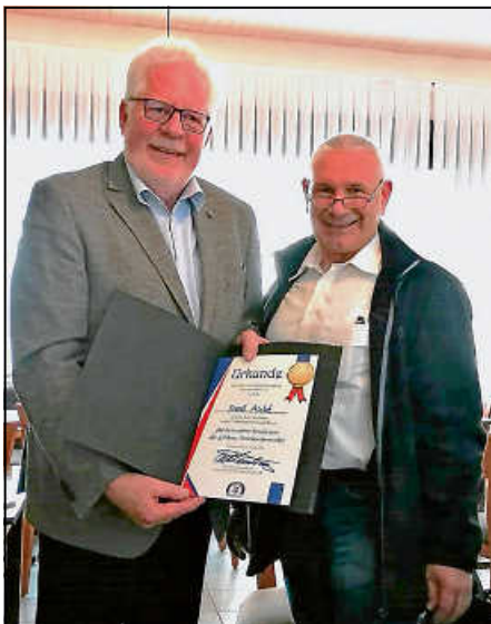
Überreichung der Urkunde