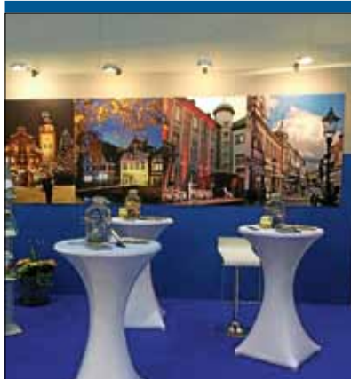
Ettlingen auf der Offerta