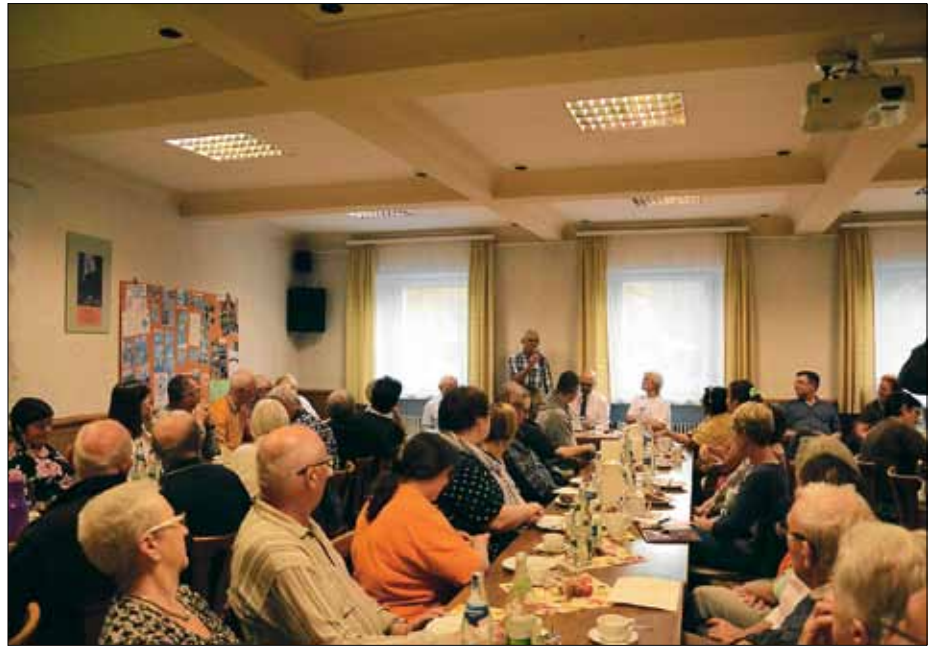
Seit 1975 treffen sie sich in Ettlingen respektive in Middelkerke die Kolpingsfamilie und die Mikajfamilie.