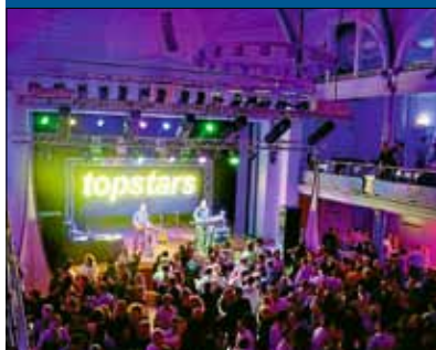
Vorverkauf für Silvesterparty