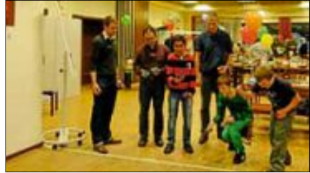
Für alle Generationen gab es Unterhaltung beim Tag der offenen Tür im Bürgertreff „Fürstenberg“ in Ettlingen-West.

Beim Tag der offenen Tür im Bürgertreff „Fürstenberg“ in Ettlingen-West kamen viele Besucher, um sich über das Angebot dieser Einrichtung zu informieren. Für musikalische Unterhaltung sorgten die Kinder der Pinocchioschule, um das leibliche Wohl kümmerten sich die Mitarbeiterinnen des Amtes für Jugend, Familie und Senioren (AJFS), der Mädchentreff sowie der Caritasverband. Für den tieferen Einblick der Besucher boten die Kooperationspartner im „Fürstenberg“ einiges, der „seniorTreff“ hatte ein Fotoatelier und ein Flohmarkt organisiert und für die ganz Kleinen bot das „Elterncafé“ eine Krabbelecke an. Auch „Freds Freunde“ wirkten mit, sie boten verschiedene Tischspiele und Crossboule an. Außerdem konnten die Kinder beim Angebot des AJFS Fühlkisten erkunden und Mosaikmalerei ausprobieren. Bei der Caritas gab es Basteln mit Kastanien. So kamen alle Generationen auf ihre Kosten.