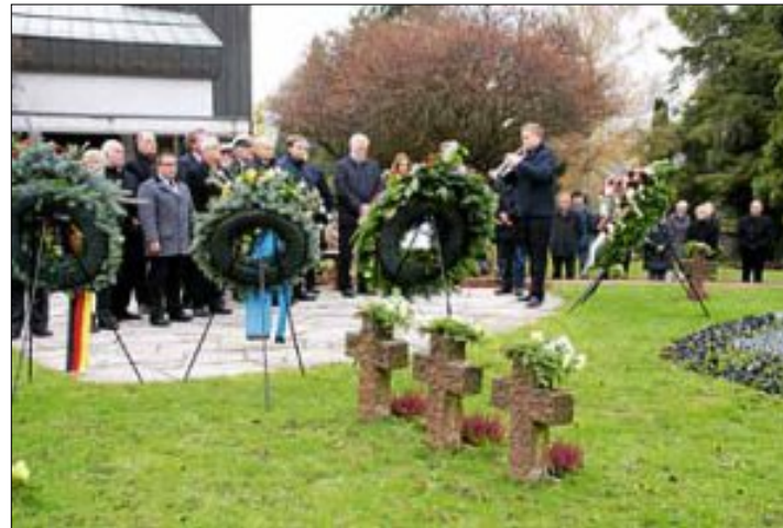
An die Toten von Krieg und Gewaltherrschaft wurde am Volkstrauertag in der Kernstadt und in den Stadtteilen mit Kranzniederlegungen gedacht.