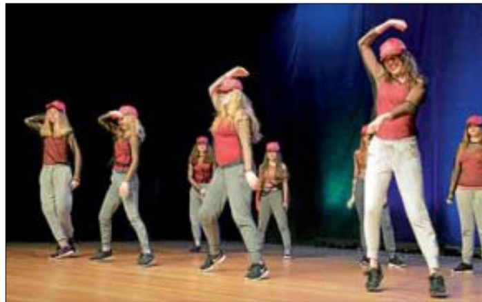
Einen Showteil bot u.a. die Tanzschule Atelier Francis aus Ettlingen/Spielberg.