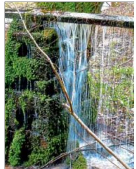
Der berüchtigte Aquaeduct-Duschvorhang garantiert Spaß, Ägdschen und Abkühlung...