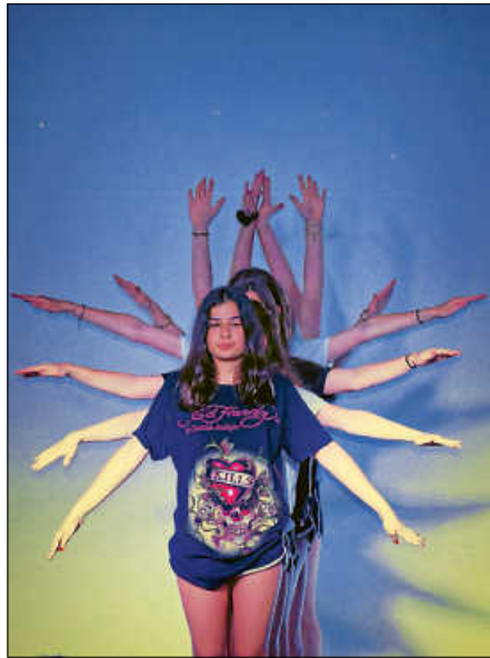
Das Theaterstück der diesjährigen 7e

kommt es zu einem lustigen Verwirrspiel mit raffinierten Tanzeinlagen, das mit derbem Vokabular und Scherzen auch dem Publikum einiges abverlangt.