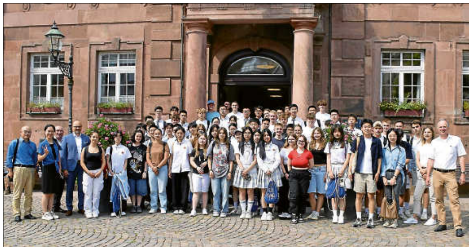
30 Schülerinnen und Schüler aus Shanghai sind derzeit bei der Wilhelm-Röpke-Schule zu Gast; die jungen Leute besuchen dort die Wusong-High-School.