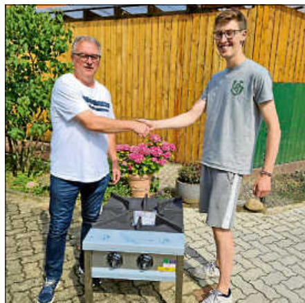
Übergabe des neuen Gasherds