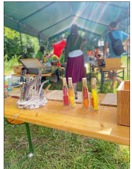
Mit Federn schreiben

Für das leibliche Wohl war bestens gesorgt: Eine Vielfalt an selbstgebackenen Kuchen, herzhaften Snacks und knusprigen Kartoffelpuffern verwöhnte die Gaumen unserer Gäste. Besonders stolz waren wir auf unseren innovativen Erdkühlschrank, der die Getränke auf natürliche Weise kühl hielt – ganz im Einklang mit unserem nachhaltigen Lebensstil.