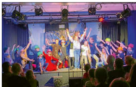
Abschlussbild der ersten Aufführung

Die Zeit eine Stunde stillstehen lassen und den Moment genießen – das konnten die Besucherinnen und Besucher bei der Aufführung der Usical-AG „Ausgetickt? Die Stunde der Uhren“ am Donnerstag, 04.07.24.