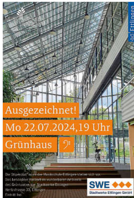
Plakat: Musikschule Ettlingen

Am Montag, 22. Juli, um 19 Uhr stellen sich die Stipendiatinnen und Stipendiaten der Musikschule Ettlingen vor. Der Eintritt für das besondere Konzert im wunderbaren Ambiente des Grünhauses der Stadtwerke Ettlingen (Hertzstraße 33, Ettlingen) ist frei.