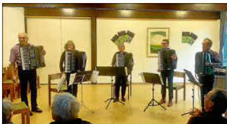
ENSEMBLE des HCB