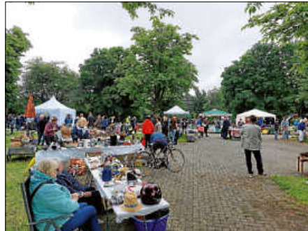
Flohmarkt Bruchhausen 2024

Alles in allem ein schöner Flohmarkt, der zum Finale dann doch mit einem Regenguss beendet wurde.