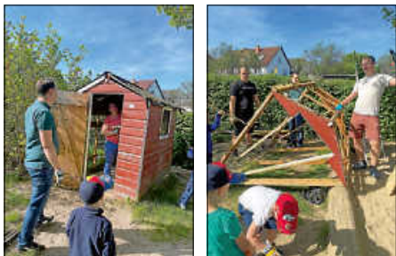
Die alte Gartenhütte Das Ende der alten

Der alten Gartenhütte wurde nämlich der Garaus gemacht. Diese ist nach vielen Jahren in Benutzung marode und instabil geworden und somit für den Kindergarten nicht mehr gut geeignet.