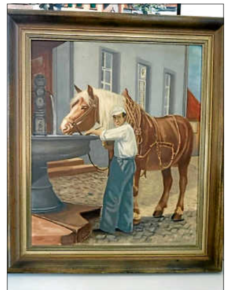
Eine historische Abbildung des Brunnens vor dem Rathaus. Im Sommer könnte er wieder plätschern.

Weitere Auskünfte erteilt das Stadtbauamt, Tel. 0 72 43/1 01 – 3 74 oder stadtbauamt@ettlingen.de