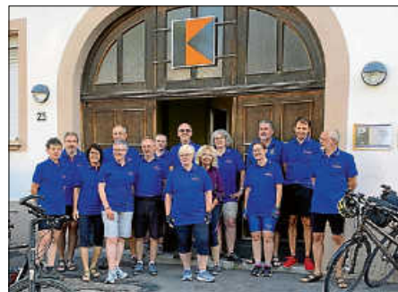
Bei dem Start vor der großen Tour nach Middelkerke.