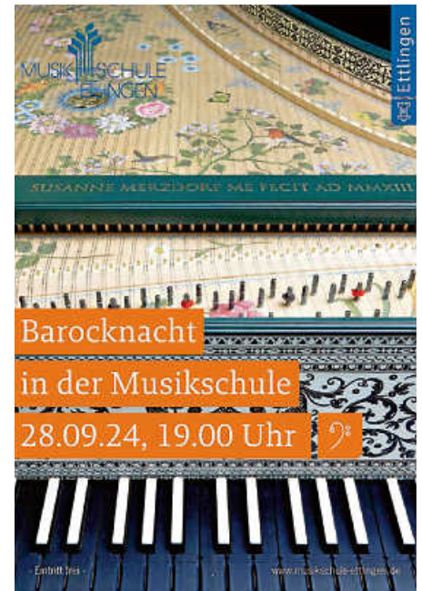
Plakat: Musikschule Ettlingen