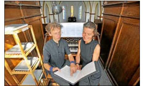
Duo Vimariss - Besprechung der Partitur