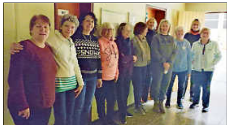
Ein bewegtes Frauengröppchen

Ein ganz großen Dank auch an die Vertretung/en von unserer Trainerin.