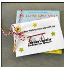
Weihnachtsgruß vom Förderverein

Als besonderes Highlight erhielten die Kinder zum Abschluss noch ein Pixi-Buch mit Eintrittskarte für das Marotte-Figurentheater als Geschenk. Dieses wird im Frühjahr wieder im Kindergarten ein schönes Theaterstück aufführen.