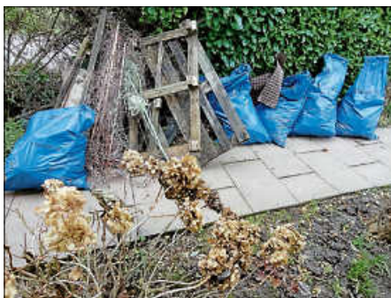
Das Ergebnis der Sammelaktion