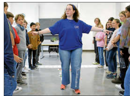
FranceMobil am Heisenberg

In vielen dieser Elemente waren die Übungen zwar recht ähnlich zum sonstigen Französischunterricht. Für die Schülerinnen und Schüler war es aber dennoch sehr schön, mit einer Muttersprachlerin zusammenzuarbeiten. Wir sagen: Merci und à bientôt, France-Mobil!