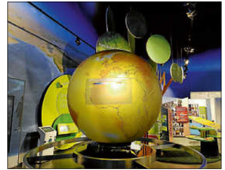
Die Themen Klimaschutz und Nachhaltigkeit stehen bei der Klima Arena in Sinsheim im Fokus.

als Eisbären über Eisschollen zu hüpfen, ein Riesenmemory zu lösen oder einen riesigen digitalen Globus zu bestaunen.