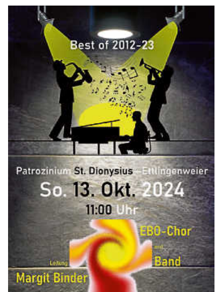
Plakat: Wolfgang Espe

Zum Patrozinium in St. Dionysius/Ettlingenweiler am Sonntag, 13. Oktober, um 11 Uhr freuen wir uns, mit den Highlights aus unseren Messen seit 2012 den festlichen Gottesdienst mitgestalten zu dürfen.