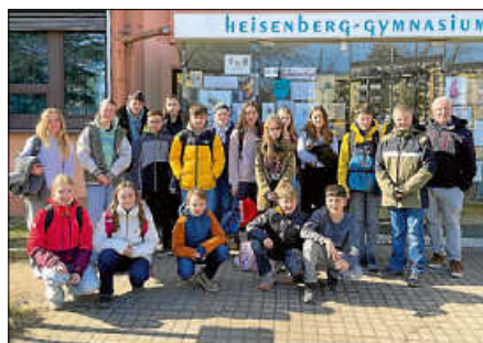
Die neuen Schüler-Medienmentorinnen und -mentoren