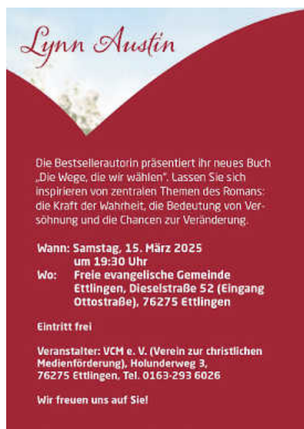
Plakat: VCM e. V.

Wo: Gemeindezentrum der Freien evangelischen Gemeinde, Dieselstraße 52 (Eingang Ottostraße)