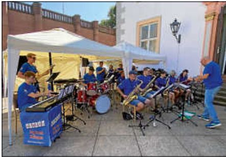
Marktfest 2024