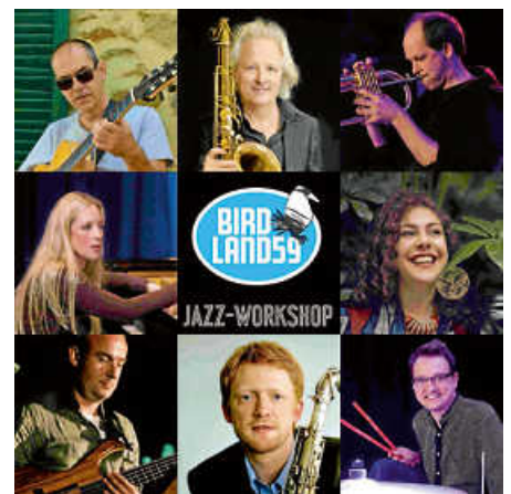
Dozenten Jazz-Workshop 2024