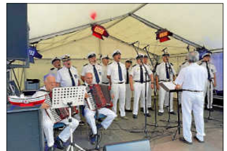
Der Shantychor sorgt beim Marktfest immer wieder für gute Stimmung

Die beiden rot/weißen Sammelschiffchen der Deutschen Gesellschaft für Schiffrüchige /DGzRS), die während des Chorauftritts durch die Besucherreihen gereicht wurden, erbrachten ein sehr erfreuliches Ergebnis. Runde 350,00 Euro konnte der Vereinskassier inzwischen an die DGzRS überweisen. Die Marinekameradschaft Ettlingen bedankt sich im Namen der Seenetretter bei allen Spendern.