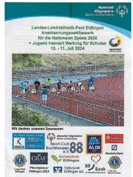
Special Olympics Sportfest

Ein großes Dankeschön an die Unterstützer und Sponsoren, ohne die dieses Fest nicht möglich wäre, Stadt Ettlingen, Aldi Süd, Lions Club Karlsruhe Fächer, Pfennigbasar, Volksbank Ettlingen, Sparkasse Karlsruhe, Hermann Gentner, N.Keller u. C. Konz Praxis für Physiotherapie, Rehasport u. Massagen. Der SC 88 Bruchhausen und die Gartenschule Ettlingen würden sich über viele Zuschauer freuen. Beginn Mittwoch und Donnerstag jeweils um 9 Uhr.