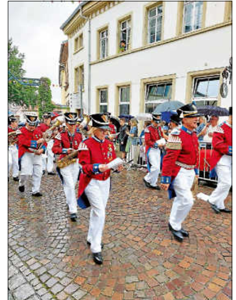
Musikkapelle beim Umzug Landestreffen in Bretten

20. Juli Jahreshauptversammlung in den Bürgerwehrräumen, Beginn um 16.30 Uhr.