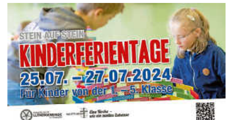
Plakat: FeG Ettlingen

Vom 25. bis 27. Juli finden wieder unsere alljährlichen Kinderferientage in Kooperation mit der FeG Ettlingen statt.