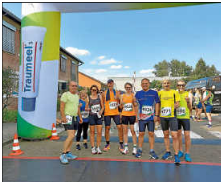
Einige vom LT Ettlingen vor dem Start auf dem Heel-Betriebsgelände in Baden-Baden