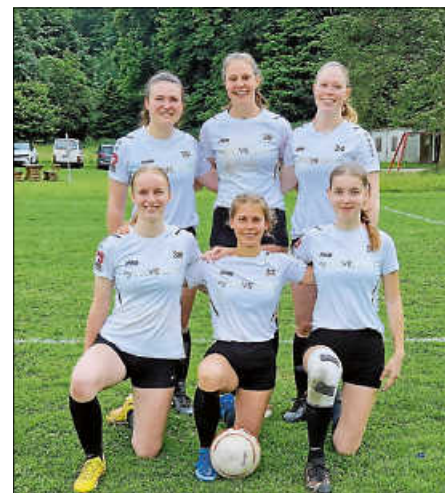
Frauenmannschaft des TV Schluttenbach