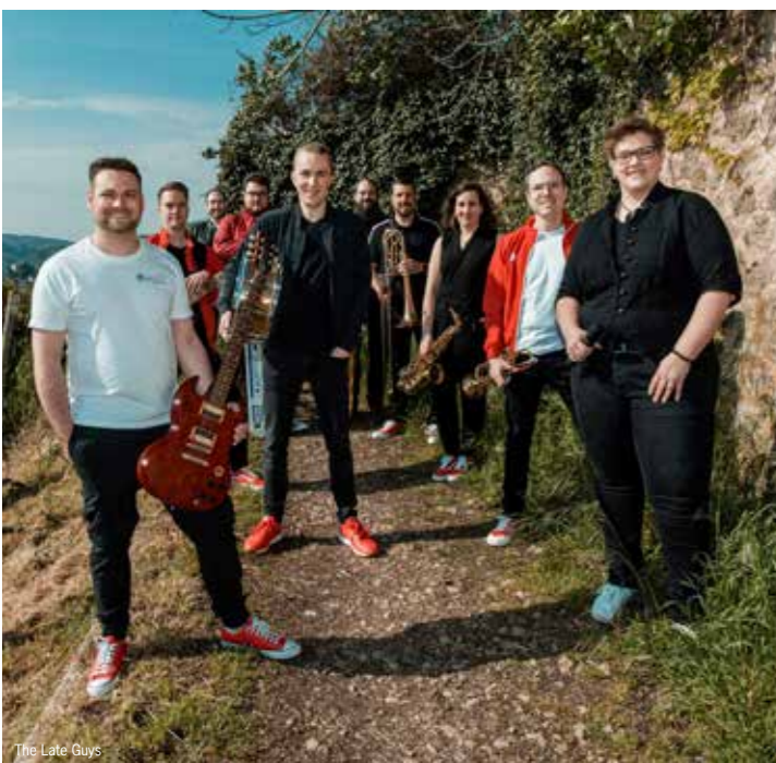
The Late Guys