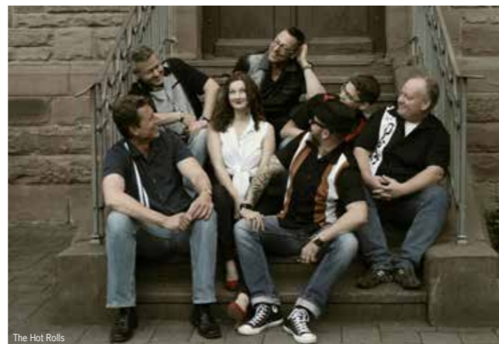
The Hot Rolls