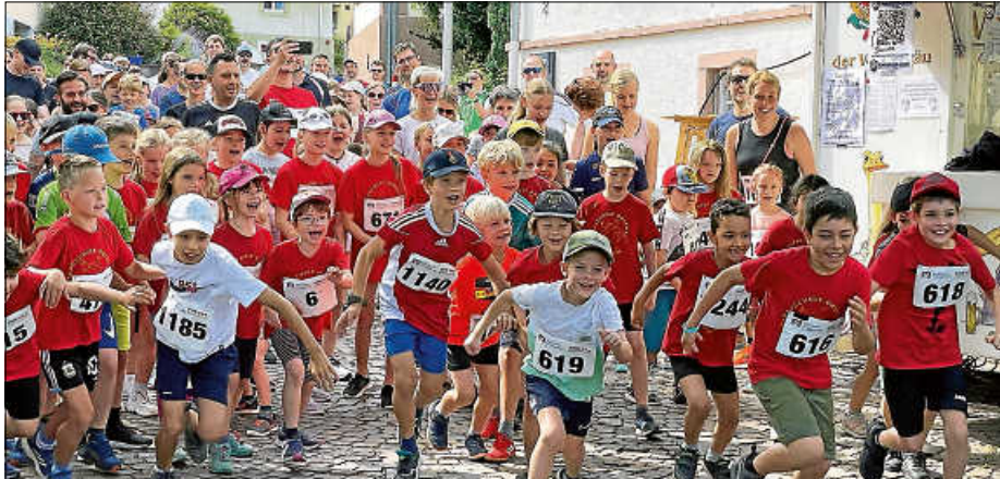
Start Dorfmarathon Grundschule Oberweier beim Dorffest