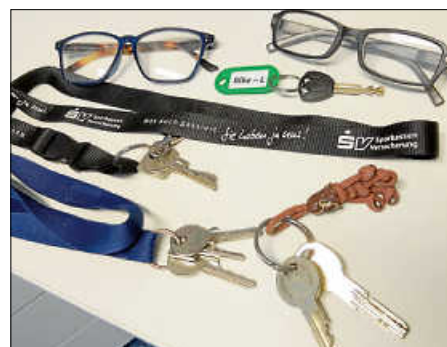
Kleine Auswahl der Fundsachen