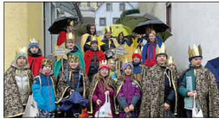
Sternsinger 2025 in Oberweier