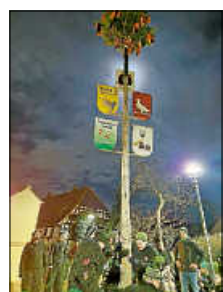
Aufstellung des Narrenbaumes