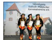
Verleihung Goldener Löwe

Am 05.01.2025 fand die Verleihung des Goldenen Löwen in der Stadthalle in Speyer statt. Diese Auszeichnung der Vereinigung Badisch Pfälzischer Karnevalvereine ist eine der größten des Verban-