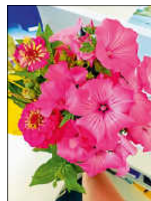
Blumen für Jubilare

Bisher wurden Alters- und Ehejubiläen im Amtsblatt veröffentlicht. Altersjubiläen sind ab dem 70. Geburtstag alle 5 Jahre und ab dem 100. Geburtstag jeder folgende Geburtstag. Ehejubiläen sind das 50. und jedes folgende Ehejubiläum. Wer dies nicht wollte, musste dieser Veröffentlichung bisher schriftlich widersprechen.