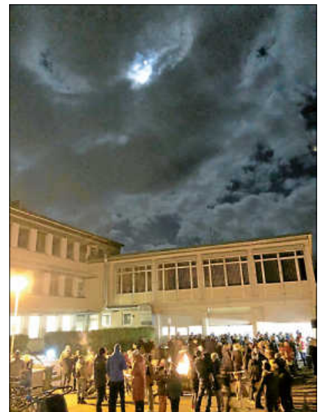
Auch der Mond schaute vorbei. Stimmungsvolle Impression vom Winterzauber

Klirrende Kälte, heißer Glühwein, lecker Essen und Feuerschale zum Aufwärmen. Genau das wussten die zahlreichen Gäste auch in diesem Jahr beim Besuch des „Winterzauber – Feuer trifft Musik“ wieder zu schätzen und so kamen Sie zum Musikverein und zur Feuerwehr, dieses Mal nicht auf den Kirchplatz von St. Josef, sondern zum Feuerwehrgerätehaus in die Rathausstraße. Der Umzug fiel nicht leicht, tauschte man doch ein sehr schönes Ambiente gegen Funktionalität ein. Ein Schritt, der sich aber gelohnt hat. Auch in diesem Jahr gab es wieder Grillspezialitäten, erstmals auch vegetarisch und vegan, Glühwein, Familienpunsch, mit „Waldhaus“ Hell und Doppelbock neue Fest-Biere in