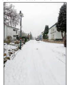
Verschneite Straße und Gehwege

Viele Menschen, natürlich vor allem die Kinder, freuen sich im Winter auf Schnee. Jedoch kommt es bei Schnee und Eisglätte zu erhöhter Gefährdung für Fußgänger und Radfahrer. Straßenanlieger haben deshalb die Pflicht, die Gehwege, Treppenanlagen und in verkehrsberuhigten Bereichen die an der Grundstücksgrenze liegende Fläche in einer Breite von 1,50 m entlang des Grundstücks zu räumen und ggf. zu bestreuen. Werktags muss bis spätestens 7 Uhr, an Sonn- und Feiertagen bis 8 Uhr dieser Pflicht nachgekommen werden. Der geräumte Schnee und das auftauende Eis sind grundsätzlich auf