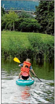
Stand-up-Paddeln-Rennen auf dem Horbachsee

Der Höhepunkt des Tages war zweifellos der Triathlon, an dem alle Klassen teilnahmen. Dieser bestand aus drei Disziplinen, die die Schülerinnen und Schüler in ihren Jahrgangsstufen gemeinsam meisterten: