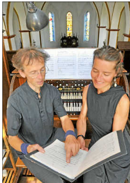
Besprechung der Partitur