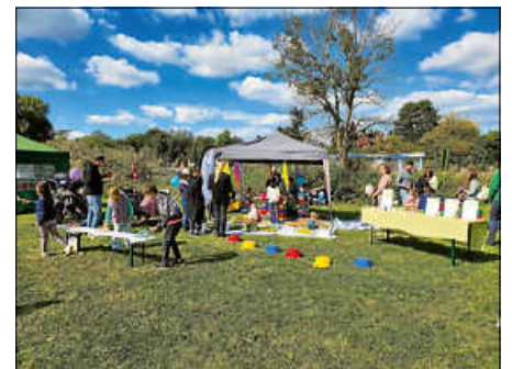
Buntes Treiben am Stand der Tagesmütter

Während die Kinder spielten, kamen Eltern und Tagesmütter rege ins Gespräch und konnten sich über die Kindertagespflege in den Räumlichkeiten der Tagesmutter informieren, austauschen und neue Kontakte knüpfen. Hierzu gab es Informationsmaterialien wie Flyer und Visitenkarten.