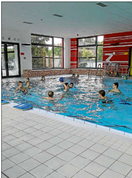
Foto: Stufe 4 bei den Ettlinger Wasserballern