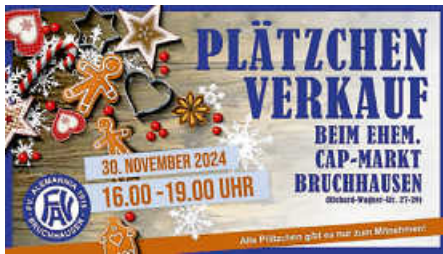
Plakat: FVA Bruchhausen

in festliche Stimmung zu versetzen – perfekt für die Vorweihnachtszeit! Wir freuen uns auf Sie!