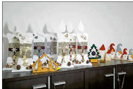
Neues aus der Wichtelwerkstatt

Wie es schon Tradition ist, besteht auch die Möglichkeit zur Adventszeit passende Deko-Artikel zu erwerben. Vielleicht suchen Sie noch das eine oder andere Geschenk?