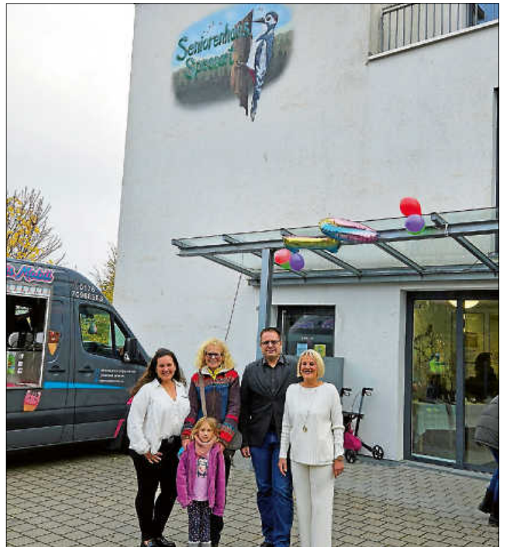
Die anwesenden Ortschaftsräte freuen sich über das gelungene „Kunstwerk“.