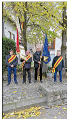
Kranzniederlegung Kriegerdenkmal in Oberweier

Im November widmet sich die Kameradschaft ehemaliger Soldaten schon seit Jahrzehnten der Pflege des ortseigenen Kriegerdenkmals am Dorfplatz und der Pflege des Gedenkstein am Waldsaumweg . Des Weiteren engagiert sich die Kameradschaft ehemaliger Soldaten bei der Haussammlung für den „Volksbund Deutsche Kriegsgräberfürsorge“ .