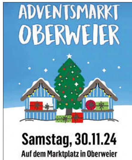
Adventsmarkt in Oberweier im Jahr 2024 Plakat: Kevin Dürr

Ende der nächsten Woche, am Samstag, den 30.11.2024, findet der Adventsmarkt statt. Der Adventsmarkt bietet wie gewohnt das gemeinsame Adventskranzbinden an. Wie immer wird für das Adventskranzbinden Tannengrün gesammelt. Wir bitten alle, die geplant haben, Ihre Tannen am besten am kommenden Wochenende zurückzuschneiden. Ab Montag, den 25. November, bringen Sie bitte Ihren Grünschnitt in die Bergstraße 1 zur Familie Bauer.