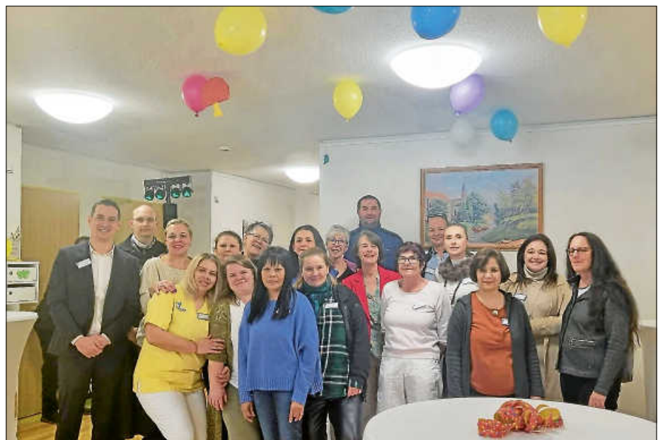
Das Team des Seniorenhauses Spessart am Festtag