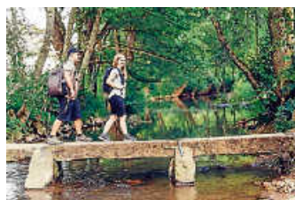
Die Römerpfade im Odenwald

Der Heimat entdecken-Newsletter präsentiert dir einmal in der Woche die schönsten Seiten von Baden-Württemberg. Werde selbst aktiv zum Heimatentdecker, lese die neuesten Artikel auf LOKALMATADOR.DE, tauche ein in die Nussbaum Erlebniswelt und lerne das Land von ganz neuen Seiten kennen.