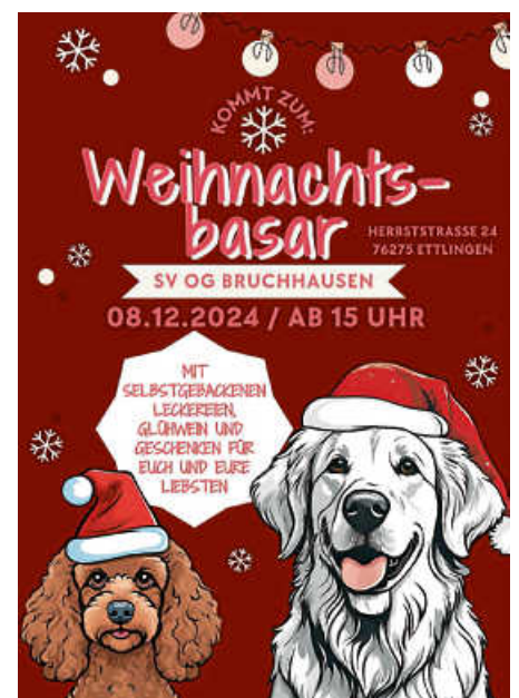
Plakat: Victoria Darnstädt

Startgeld beträgt pro Mensch/Hund Team 6 €