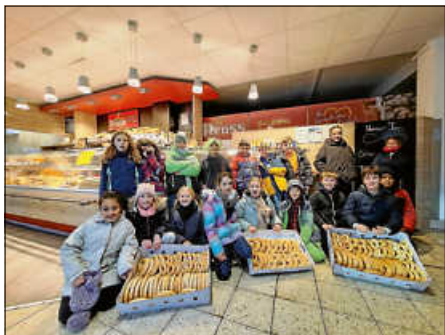
Klasse 4a bei der Bäckerei Reuss

Vielen Dank an unseren Förderverein, der das organisiert und bezahlt hat, und an die Bäckerei Reuss für den besonderen Martins-Rabatt.