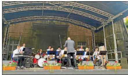
50 Jahre Gesamtstadt Ettlingen