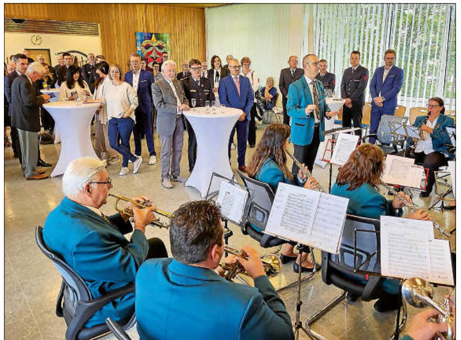
Festakt Feuerwehr Bruchhausen