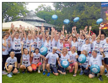
„von 0 auf 10.000“ vor dem Start voller Freude

Bleibt dran und habt weiterhin viel Spaß am Laufen. Uns hat es sehr viel Freude bereitet, so viele glückliche Gesichter beim Zieleinlauf zu sehen.