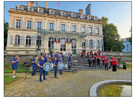
Knoddler in Epernay