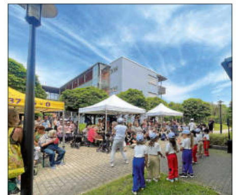
Sommercafé vom 08.06.2024, Tanzeinlage der Schreiberjugend Ettlingen