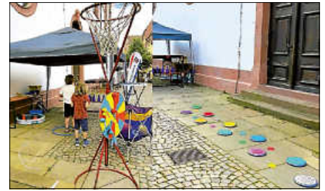
Mitmachstand der SSV Ettlingen