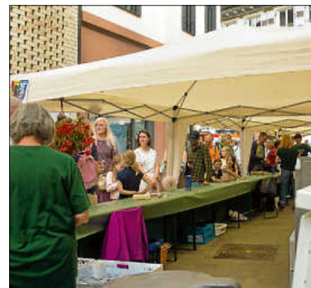
Unser Angebot fand regen Zuspruch.

Letztendlich erklärten über dreißig aktive Mitglieder im Vorfeld ihre direkte oder indirekte Mitwirkung an der Durchführung der Veranstaltung und so konnten wir ein reichhaltiges Kuchenbuffet, ausgewählte Kaffee-Spezialitäten und frisch gebackene belgische Waffeln den Gästen anbieten. An der Stelle möchten wir uns noch bei all denjenigen entschuldigen, die dann doch etwas länger in der Waffel-Warteschlange stehen mussten. Durch den Ausfall eines Waffel-eisens war unsere Back-Kapazität schlagartig um 50 % reduziert. Wir hoffen, dass der Duft und der Geschmack der frischen, heißen Waffeln dann doch noch ein klein wenig dafür entschädigt haben.