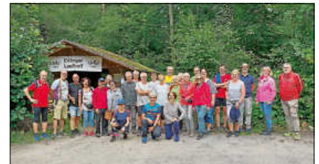
Sommerfest LT Ettlingen

men doch viele zum traditionellen Sommerfest des LT Ettlingen am 19. Juni. Das Wetter spielte mit und die Läuferinnen und Läufer konnten vorher noch kleinere Laufgruppen machen. Danach ging man zum gemütlichen Teil des Festes mit kühlen Getränken, selbstgemachten Salaten, heißer Wurst und Kuchen über. Die Stimmung war mit vielen netten Gesprächen ausgelassen und gut. Es war ein schöner Abend bei der Lauftreffhütte Beim Runden Plom.