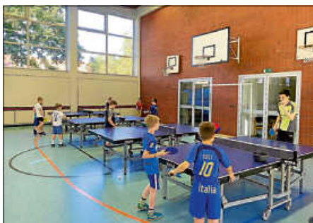
Foto: Schnupperstunde im Eichendorff-Gymnasium

Ein großes Danke an die spontane und schöne Zusammenarbeit, die Kinder hatten viel Freude beim Spielen!