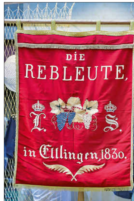
Die Vereinsfahne erstrahlt im Sonnenlicht.

Gelingen der Feierlichkeiten beitragen konnten und auch der Verein wieder einmal eine Gelegenheit gefunden hat, sich in der Öffentlichkeit zu präsentieren. Ebenfalls Jahrzehnte zurück liegt ein offizieller Aushang unserer Vereinsfahne, die bei dieser Veranstaltung nun wieder einen würdigen Platz gefunden hat. Dabei handelt es sich um eine Replik aus dem Jahr 1980, die Original-Fahne aus dem Jahr 1830 befindet sich im Albgaumuseum.