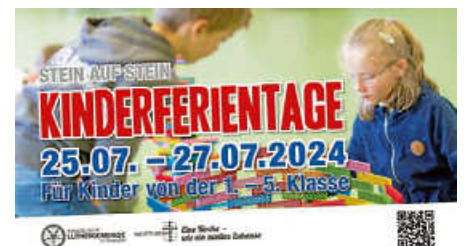
Plakat: FeG Ettlingen

Vom 25. bis 27. Juli finden wieder unsere alljährlichen Kinderferientage in Kooperation mit der FeG Ettlingen statt.