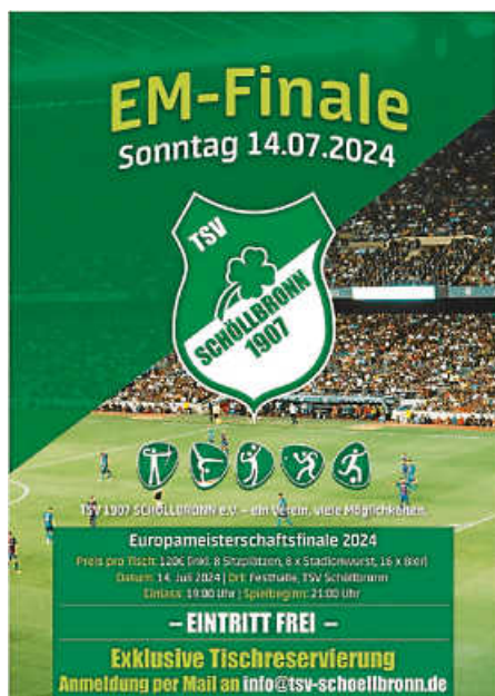
Plakate: TSV 1907 Schöllbronn e. V.