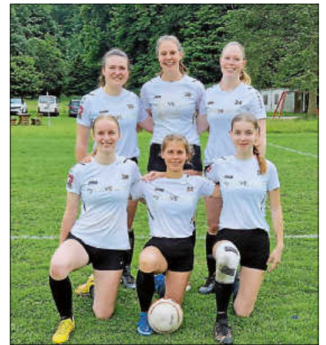
Frauenmannschaft des TV Schluttenbach