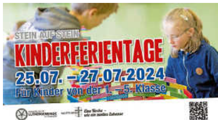
Plakat: FeG Ettlingen

Vom 25. bis 27. Juli finden wieder unsere all-jährlichen Kinderferientage in Kooperation mit der FeG Ettlingen statt.