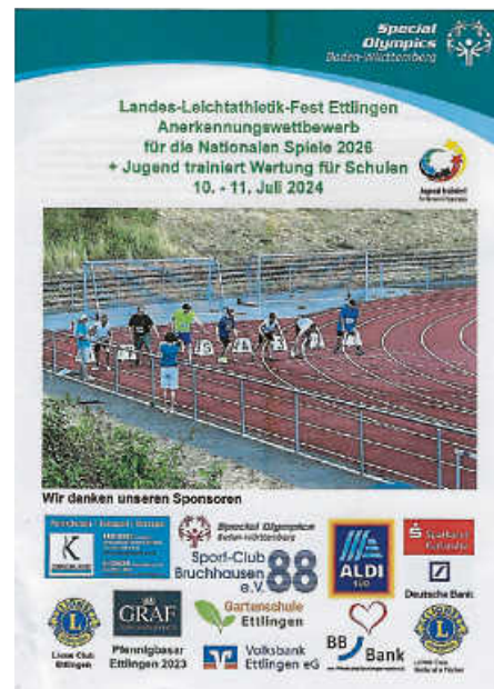
Special Olympics Sportfest