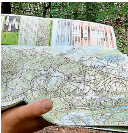
Karte lesen muss man üben

Samstags haben wir uns zu einem Wanderausflug getroffen. Mit dabei waren drei unserer aktiven jungen Leute und zwei Betreuer, das heißt, wir waren zwar eine relativ kleine Gruppe, hatten aber trotzdem viel Spaß. Los ging es so gegen 10 Uhr in Ettlingen am Bahnhof. Von dort sind wir dann gemeinsam mit der Bahn nach Gaggenau gefahren. Während der Bahnfahrt und dann auch vor Ort in Gaggenau haben die Jung-Wanderer auf der Karte den Weg nachgeschaut.