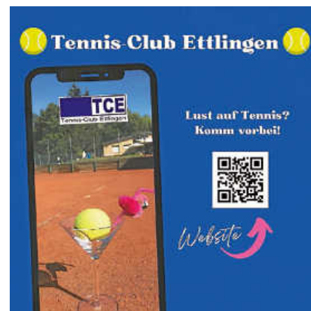
Plakat: TC Ettlingen

Du bewegst dich gerne an der frischen Luft? Du hast Spaß am Spielen mit Bällen? Du hast Lust gemeinsam im Team und Einzeln auf dem Platz zu stehen? Dann komm vorbei und probiere dich im Tennis aus!