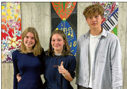
Das Schülersprecherteam des AMGs

Ein Jahr voller Engagement und Erfolg! Die SMV (SchülerMitVerantwortung) hat in diesem Schuljahr zahlreiche beeindruckende Projekte umgesetzt und das Schulleben bereichert.