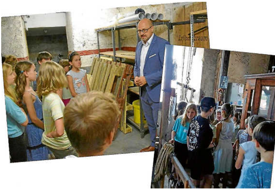
Blick hinter die Kulissen: auf der Tour durchs Rathaus sahen die Ferienpasskinder Verborgenes und erhielten ungewöhnliche Eindrücke, tief unten im Keller und droben auf dem Turm.