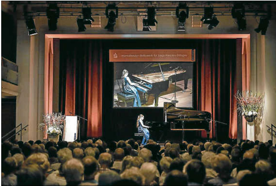
Die Rekord-Anmeldezahlen zum Pianistenwettbewerb zeugen von der hohen Qualität und Wertschätzung. Das Preisträgerkonzert ist wieder in der Stadthalle (Archivfoto).