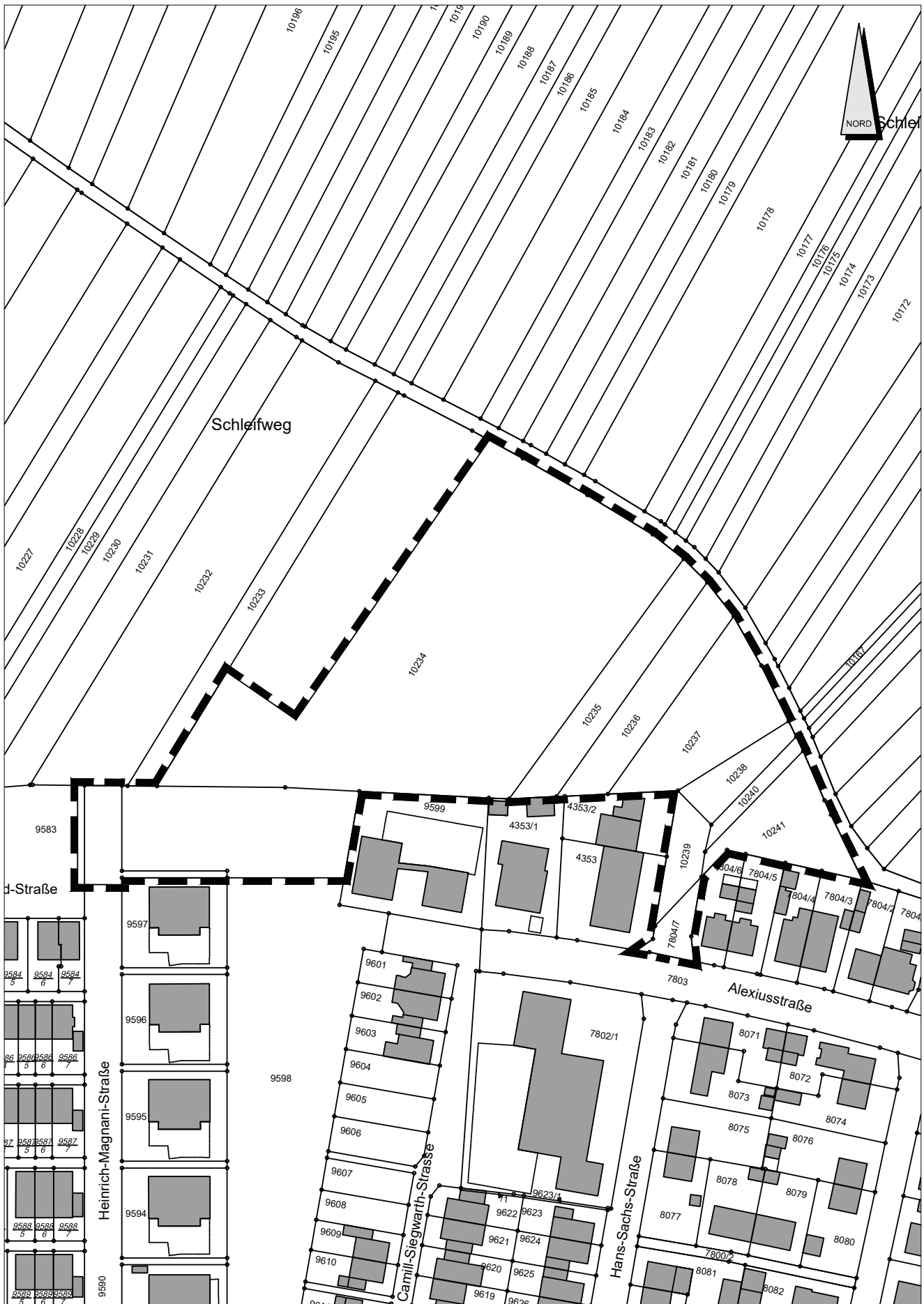
Bebauungsplan „Schleifweg / Kaserne Nord – Teilbereich Kita + Wohnen Ost“ Übersichtslageplan I