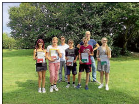
Die diesjährigen Preisträger*innen des Schreibwettbewerbs „Lust am Schreiben“

Der Wettbewerb unterstrich die Bedeutung von Literatur in der schulischen Bildung. Kreatives Schreiben fördert nicht nur die sprachlichen Fähigkeiten, sondern auch das kritische Denken und die Fähigkeit, komplexe Zusammenhänge zu verstehen und darzustellen. Durch das Schreiben können Schülerinnen und Schüler ihre Gedanken und Ideen ausdrücken, ihre Stimme finden und ihre Persönlichkeit entwickeln.