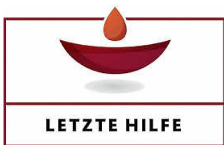
Grafik: Letzte Hilfe