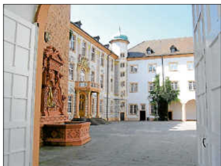
Ansicht Südflügel von Osten.

Wegen umfangreicher Umbauarbeiten im Schlosshof nach Beendigung der Schlossfestspiele bleibt das Museum im Schloss bis Sonntag, 25. August geschlossen.